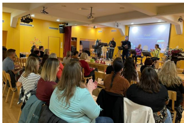
Vesela novica je novembra pripravila čudovito predbožično delavnico za vse, ki delajo z otroki.

Sodeluj z Mozaik Misijo in imej vpliv na narode.