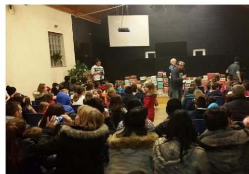
Otroci v Sarajevu

Molimo za ekipo treh sester, ki bodo potovale in služile tam. Razmislimo, kako lahko tudi sami prispevamo za razširjanje evangelija med temi otroki. Nakažite prispevke na račun Mozaika in v namen vpišite »Otroci v Sarajevu« in vsi prispevki bodo šli 100% za te otroke v potrebi.