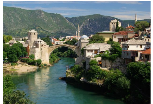
Misijonarsko potovanje z Mozaikom v Banja Luki, Jajce, Sarajevu in Mostar.

Zelo smo veseli, da imamo ekipo osmih ljudi, ki se bodo od 2. do 7. oktobra odpravili na misijonarsko potovanje v Bosno in Hercegovino. Ekipa bo obiskala pastore v Banja Luki, Jajcu, Sarajevu in Mostarju. Cilj tega potovanja je vzpodbuditi lokalne delavce, izgraditi medsebojne odnose po premoru zaradi Covida, izvedeti kakšne so možnosti za služenje na tem območju in kakšne so potrebe. Povezovanje s pastorji, ki delajo v teh težkih pogojih, je vedno dragoceno in spodbudno. Prosimo, molite za varno pot in da smo lahko na spodbudo vsem, s katerimi se srečamo.